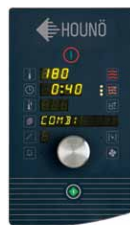
B modèle standard