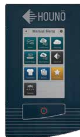
BPE modèle touch