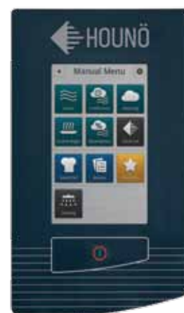
CPE modèle touch