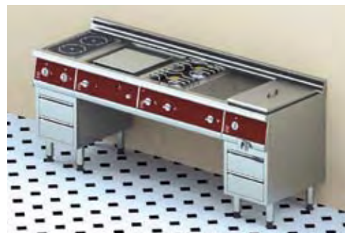
Ensemble en pont adossé (possibilité de glisser un soubassement réfrigéré)