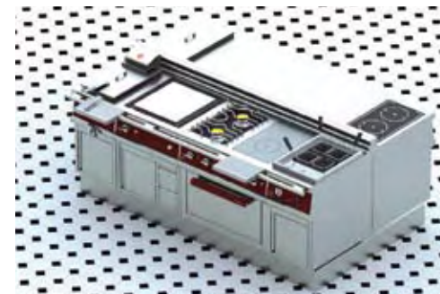
Ensemble de réchauds + soubassements formant un îlot central