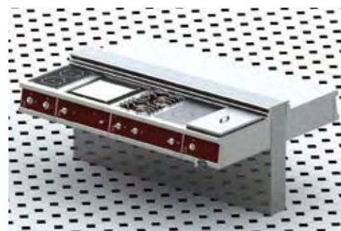
Ensemble de réchauds suspendu sur muret inox ou maçonné