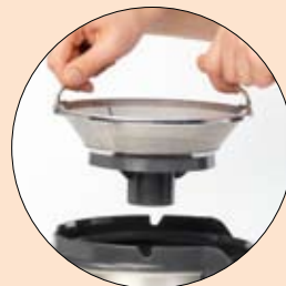
Panier inox amovible