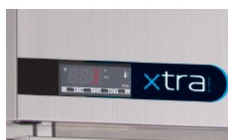
Régulateur intelligent, simple d'utilisation et visible.