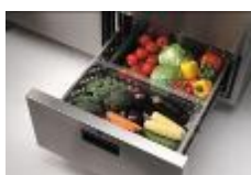
Tiroirs en option pour moduler votre stockage