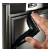
Joints amovibles pour un nettoyage aisé