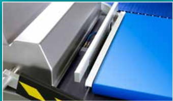
SYSTÈME AUTOMATIQUE INTÉGRÉ