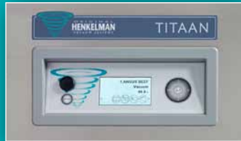
SYSTÈME DE CONTRÔLE AVANCÉ